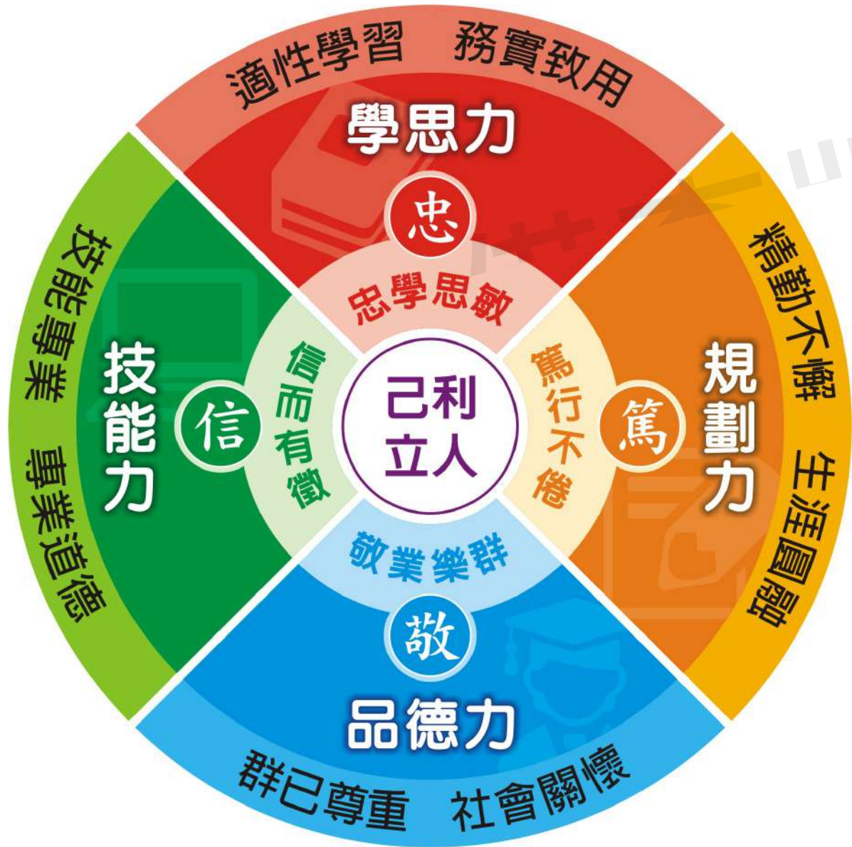
學校願景與學生圖像之對應關係